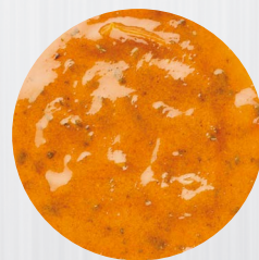
*Sixty Six®* Art. Nr.: 180308