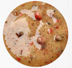
*Bunter Pfeffer* Art. Nr.: 180345