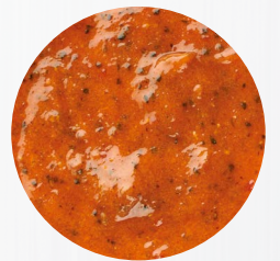
*Curry rot* Art. Nr.: 180303