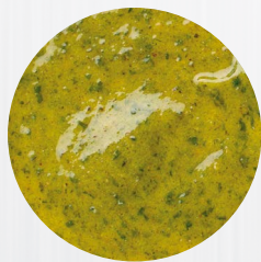
*Knoblauch* Art. Nr.: 180304