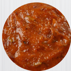
*Rosmarin* Art. Nr.: 180527