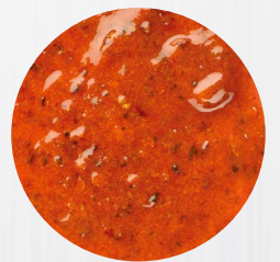
*Mexico* Art. Nr.: 180314