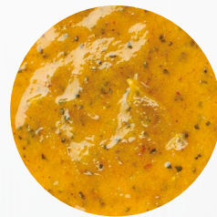
*Curry gelb* Art. Nr.: 180323