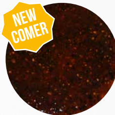
*Blacky* Art. Nr.: 180378