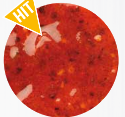
*Bordeaux Spezial* Art. Nr.: 180330