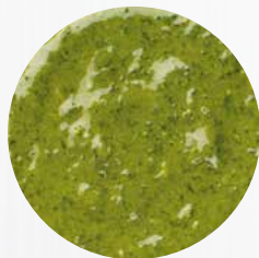
*Bärlauch* Art. Nr.: 180369