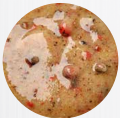
*Bunter Pfeffer* Art. Nr.: 180345