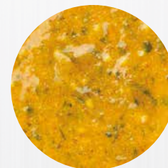
*Koh Chang* Art. Nr.: 180372