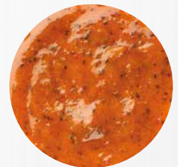
*Curry Rot* Art. Nr.: 180303