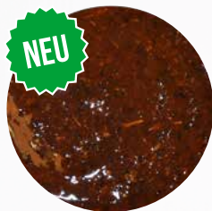
*Bergkräuter* Art. Nr.: 180554