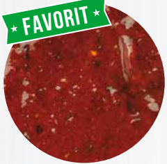
*Andalusia* Art. Nr.: 180270