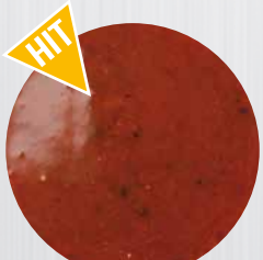
*Red Label** Art. Nr.: 180467