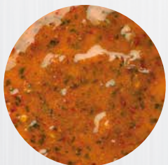
*Grillbutter* Art. Nr.: 180359