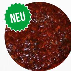
*Charlotte* Art. Nr.: 180557