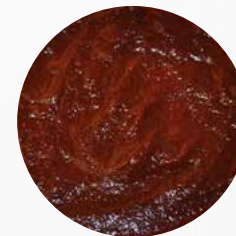
*Chicken-Kracher* Art. Nr.: 460222