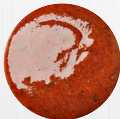
*Jamaika* Art. Nr.: 180453